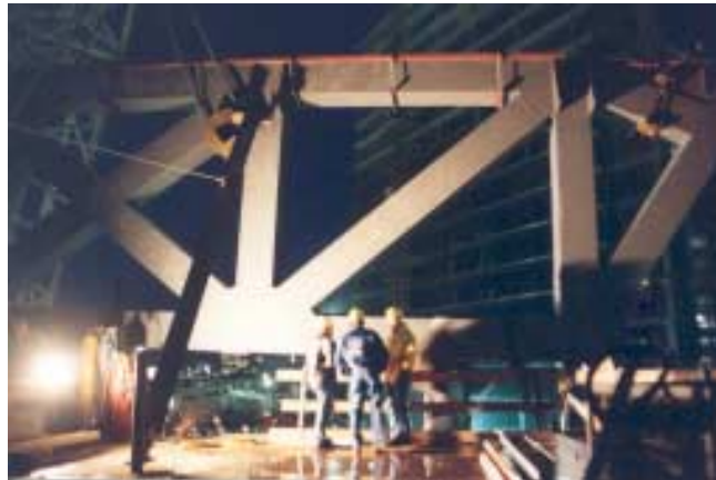
Statik, Konstruktion, Prüfung und Bauüberwachung von schwerem Stahlbau mit hochfesten geschweißten Feinkornbaustählen - SONY Center Berlin, Haus F (Esplanade)